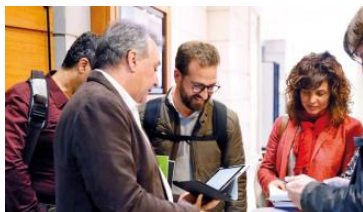
El Parlamento acusa a los canarios de "despreciar" su cultura por "ignorancia"